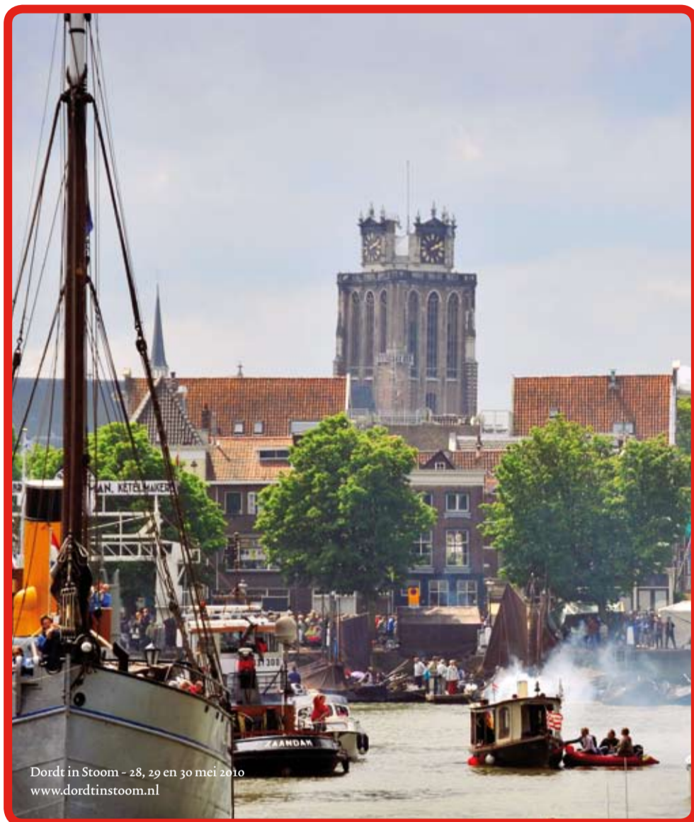
Dordt in Stoom - 28, 29 en 30 mei 2010 www.dordtinstoom.nl